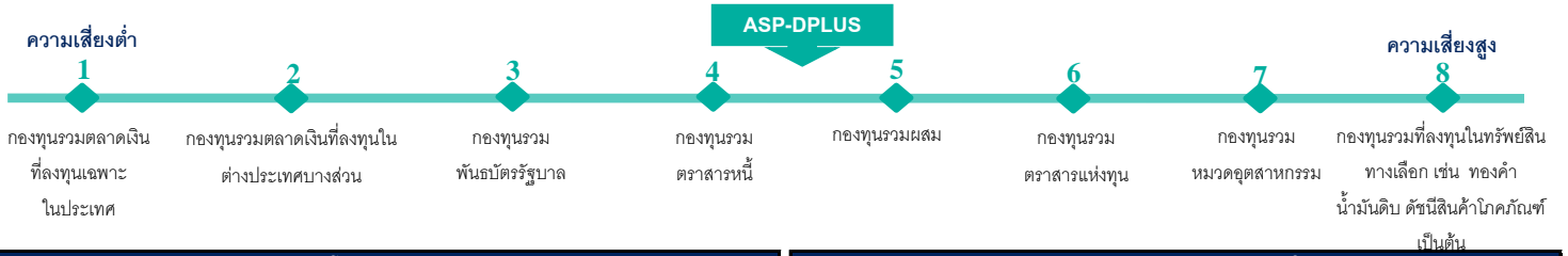
แผนภาพแสดงตำแหน่งความเสี่ยงของกองทุนรวม